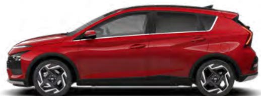
Dragon Red Pearl Kontrastdach verfügbar