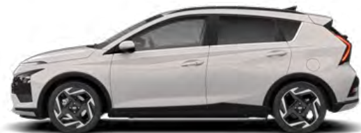
Lumen Gray Pearl Kontrastdach verfügbar