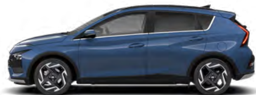
Vibrant Blue Pearl Kontrastdach verfügbar