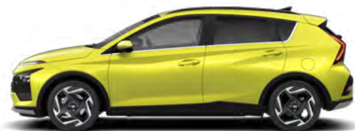
Lucid Lime Metallic Kontrastdach verfügbar