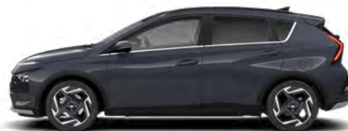
Aurora Gray Pearl