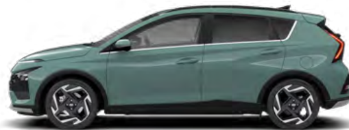
Mangrove Green Pearl Kontrastdach verfügbar